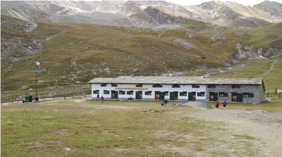
Veduta del rifugio V. Sella.